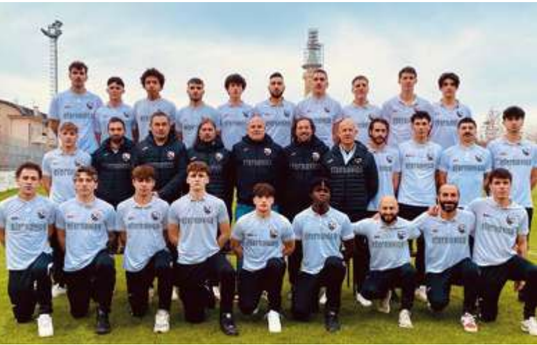
Calcio U.S. Arcella La seconda squadra della città di Padova

Informativa Durante l'ultimo anno di rendicontazione, abbiamo confermato e rafforzato il nostro impegno nel sostegno a realtà sportive locali, in particolare attraverso la sponsorizzazione di associazioni e società dilettantistiche attive sul territorio. Abbiamo infatti sostenuto economicamente diverse squadre e associazioni sportive locali, attive in discipline come calcio, volley, golf. Queste azioni confermano il nostro impegno costante nel favorire la partecipazione attiva alla vita della comunità e il rafforzamento del legame con il territorio.